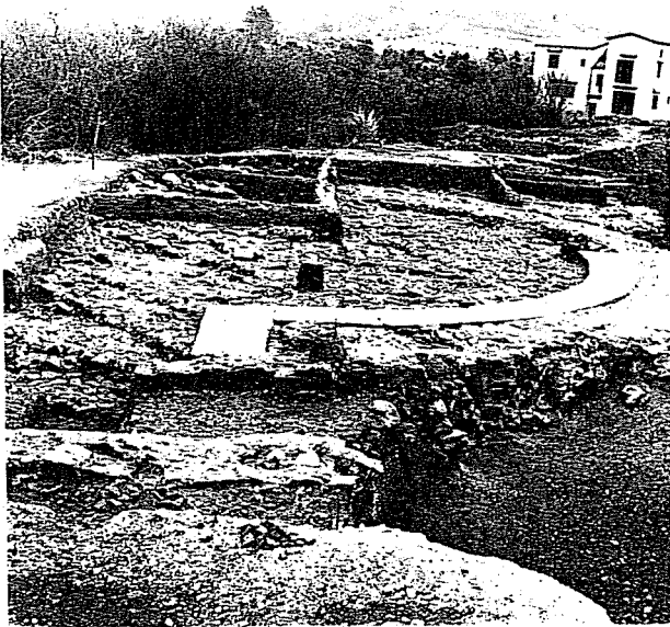
Εικ. 3: Άποψη από ΒΔ. της ημικυκλικής εξέδρας στο ρωμαϊκό βαλανείο της Οινόης.