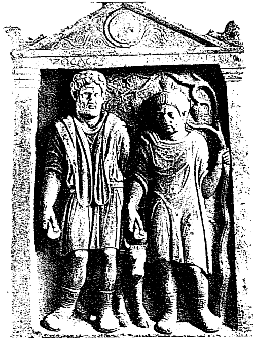
Εικ. 5: Ανάγλυφη επιτύμβια στήλη του 2ου αι. μ.Χ. από τον Μαραθώνα.