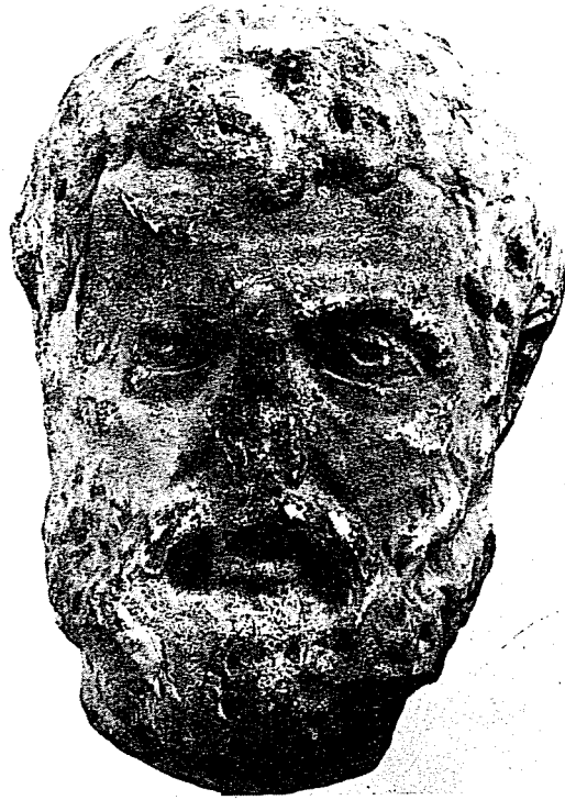
Εικ. 4: Πορταίτο του Ηρώδη Αττικού.