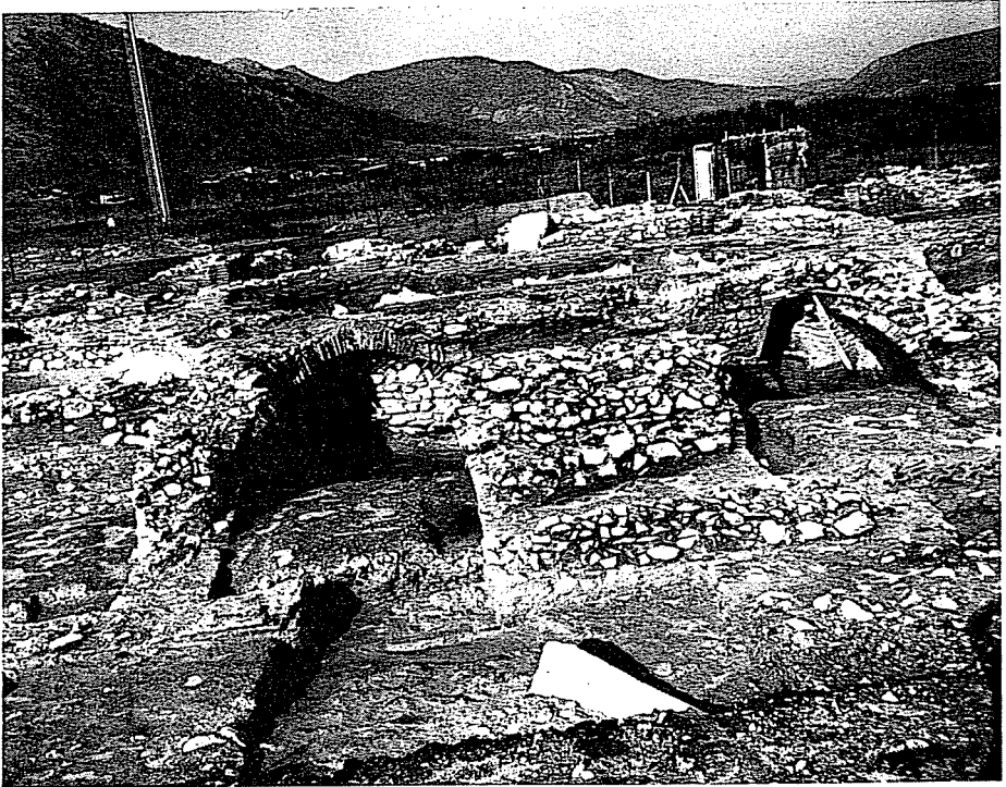
Εικ. 1: Άποψη από Α. των δύο θολωτών διαδρόμων του βαλανείου.