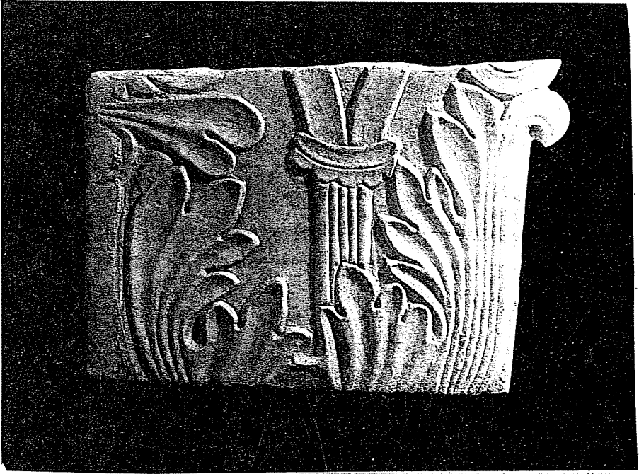
Εικ. 2: Τμήμα ανάγλυφης ορθομαρμάρωσης από το βαλανείο.