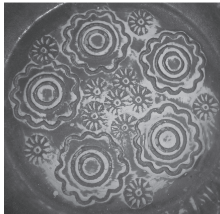
Εικόνα 8: Χαραγμένη η πασιφλώρα στον πηλό.