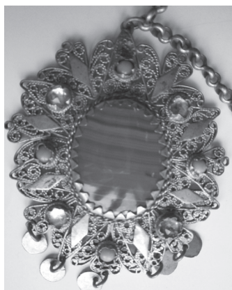
Εικόνα 5: Λεπτομέρεια του κοσμήματος.