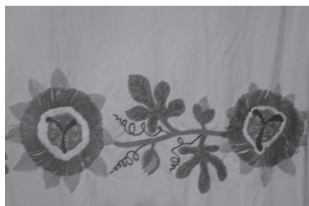
Εικόνα 6: Κέντημα Μαργαρίτας Τσεβά, μητέρας μου.