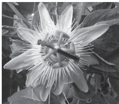
Εικόνα 1: Λουλούδι πασιφλώρα (ρολόι)