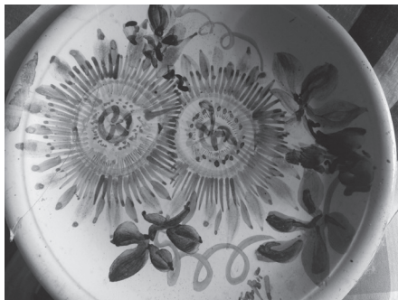
Εικόνα 7: Ζωγραφική σε κεραμικό πιάτο.