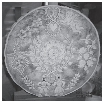
Εικόνα 2: Νυφική κουλούρα.