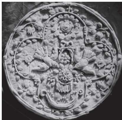
Εικόνα 3: Νυφική κουλούρα.