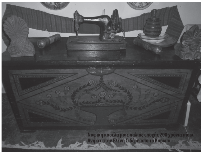
Νυφική κασέλα μιας παλιάς εποχής 200 χρόνια πίσω. Ανήκει στην Ελένη Σιδέρη από το Κορωπί.