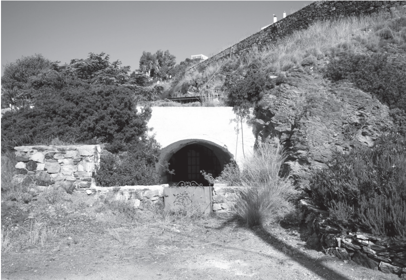
3: Στοά μεταλλείων στο Εννιά Κερατέας, όπως έχει διαμορφωθεί σήμερα. Χρησιμοποιήθηκε στη διάρκεια της κατοχής για τις διαφυγές από την οργάνωση “Κόδρος”, φωτ. Γιώργου Βασιλακόπουλου.