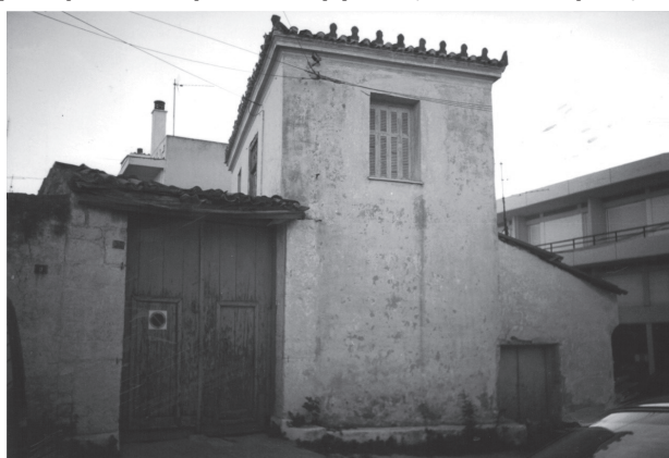
Σπίτι στον βόρειο τομέα που σχετίζεται με τη Μονή Πεντέλης.