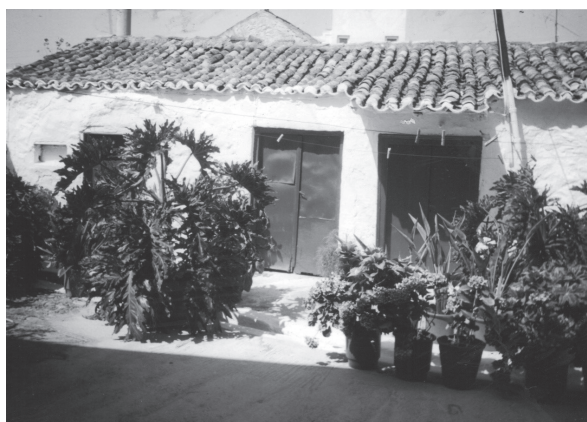
Σπίτι στον βόρειο τομέα του οικισμού που αναφέρεται ως βοηθητικό οίκημα της Μονής Πεντέλης.