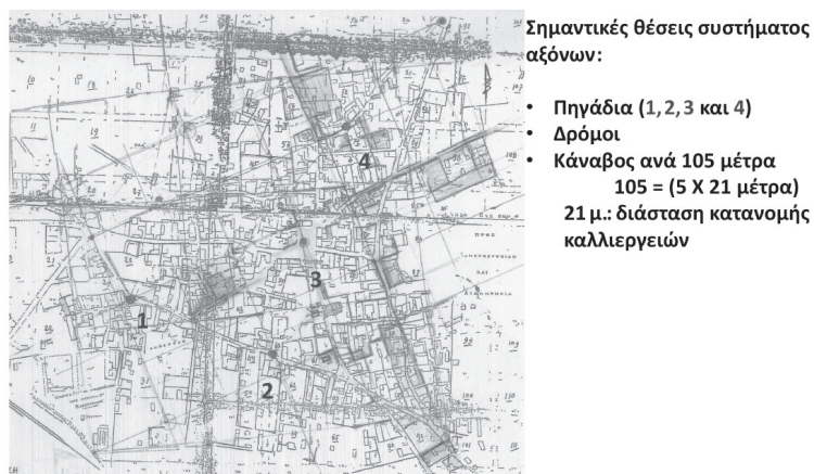
2. Εντοπισμός αρχαίων χαράξεων και χωροδομών βάσει των σωζομένων ιχνών.