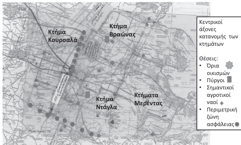
1. Οργάνωση των κτημάτων κατά τους βασικούς άξονες του οικισμού.