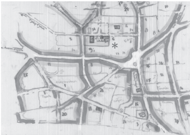
5. Διανομές του 18ου αιώνα, κτήμα Αγ. Θέκλας.

Γειτονιά-«Μαχαλάς»: πυρήνες του αρχικού οικισμού