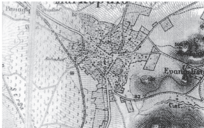
10. Γραμμική ανάπτυξη (Καupert, 1882).