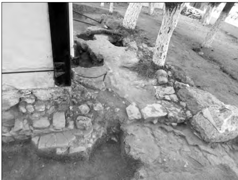
Εικ. 7. Ο χώρος νότια του ναού. Άποψη από Δ.