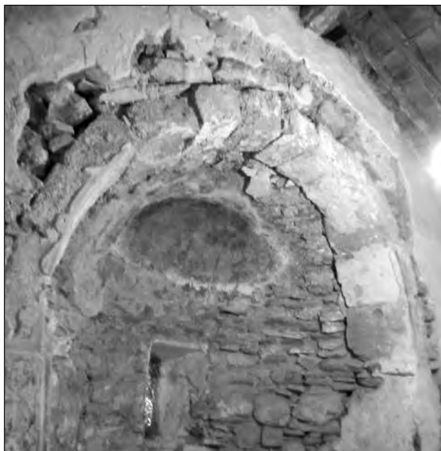
Εικ. 3. Η τοιχοποιία της αψίδας, κατά τις εργασίες.