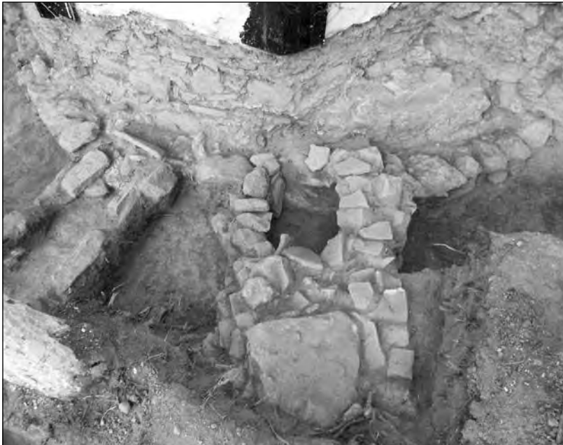
Εικ. 6. Η ανασκαφή ανατολικά. Η βάση της τρίπλευρης αψίδας, η λιθοκατασκευή και ο τάφος 11.