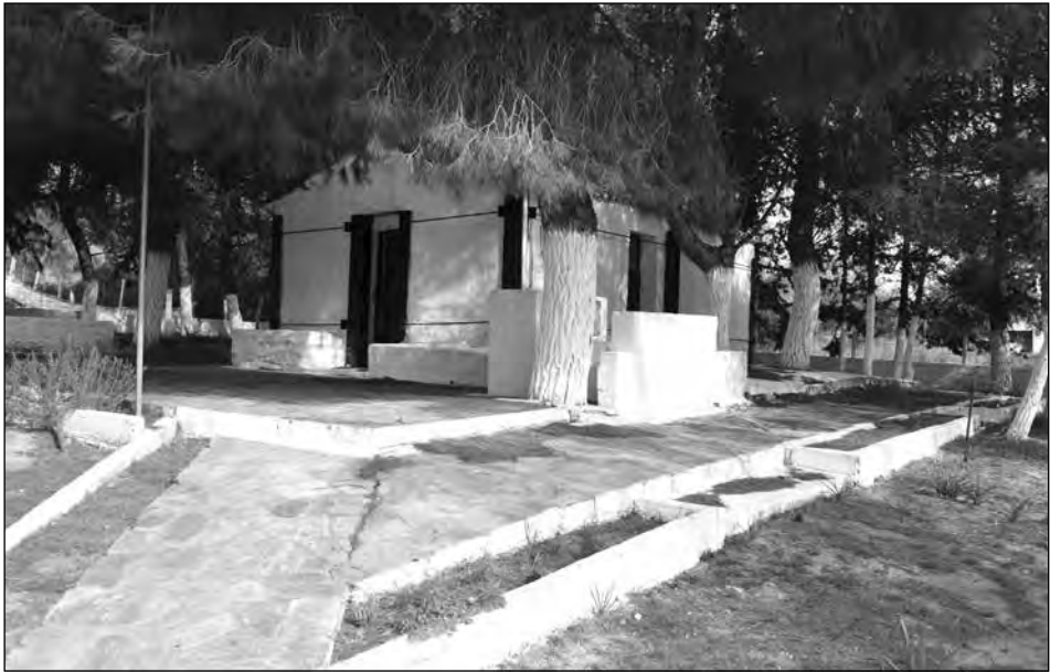
Εικ. 1. Ο ναός πριν τις εργασίες. Άποψη από ΝΔ.