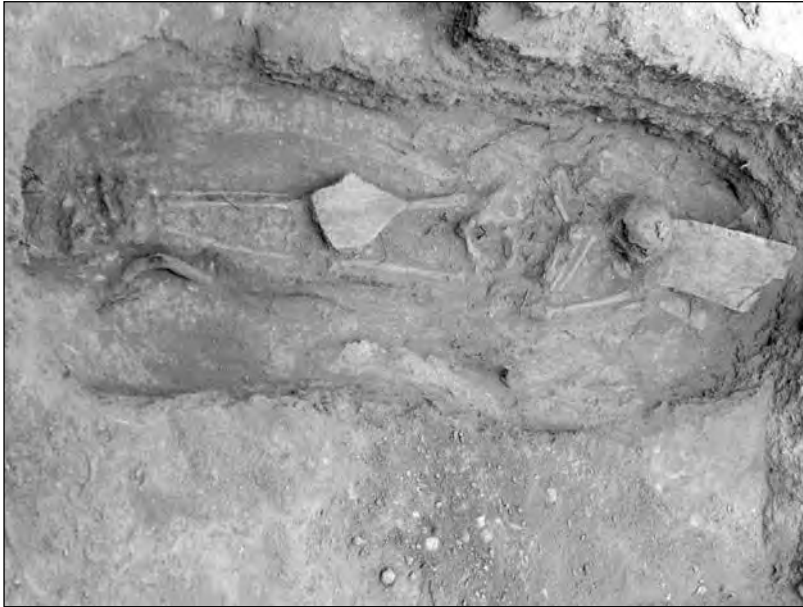
Εικ. 11. Ο νεκρός του τάφου 7. Από Β.