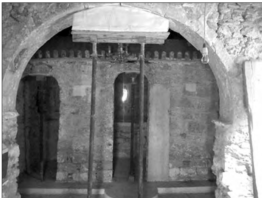
Εικ. 4. Το ενισχυτικό τόξο και το τέμπλο, κατά τις εργασίες.