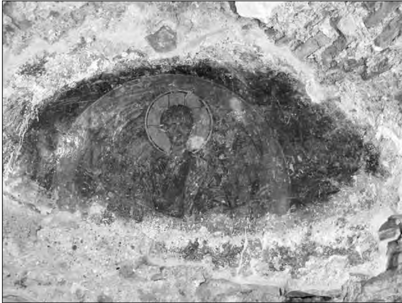
Εικ. 5. Ο τοιχογραφικός διάκοσμος στο τεταρτοσφαίριο της αψίδας.