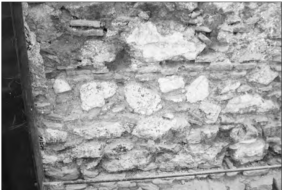
Εικ. 2. Λεπτομέρεια του εξωτερικού βόρειου τοίχου του ναού, μετά την αφαίρεση των επιχρισμάτων.