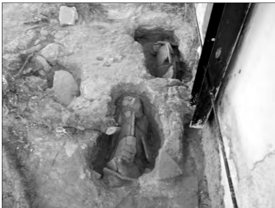
Εικ. 8. Οι τάφοι 3 και 4.