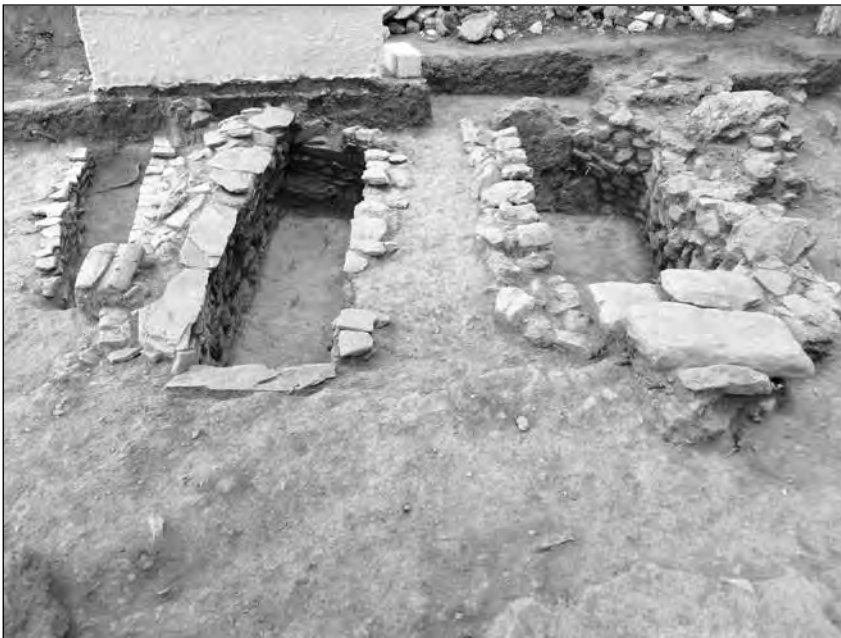
Εικ. 12. Οι κτιστοί κιβωτιόσχημοι τάφοι 12, 13 και 14. Από Α.