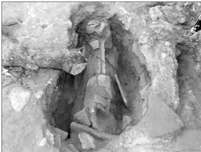
Εικ. 9. Ο τάφος 4. Από Α.