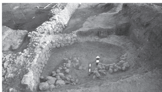
Εικόνα 6. Κτιστή ημικυκλική κατασκευή και τοίχος 14.