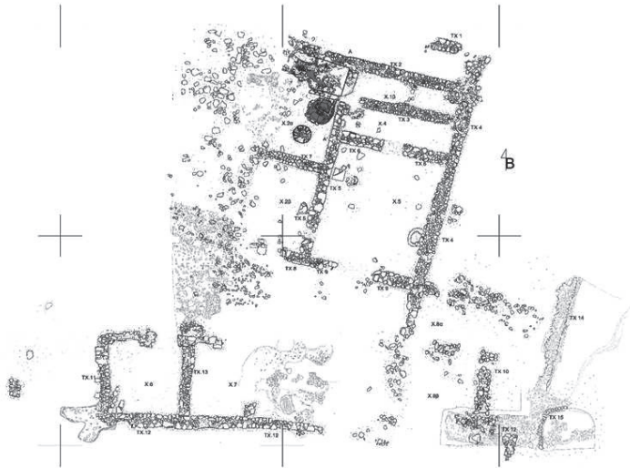
Εικόνα 1. Σχεδιαστική αποτύπωση του κτηριακού συγκροτήματος.