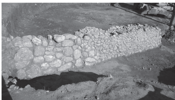
Εικόνα 5. Η ανατολική όψη του τοίχου 14.