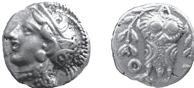
Εικόνα 7. Ασημένιο τριβόλο, 350-295 π.Χ.