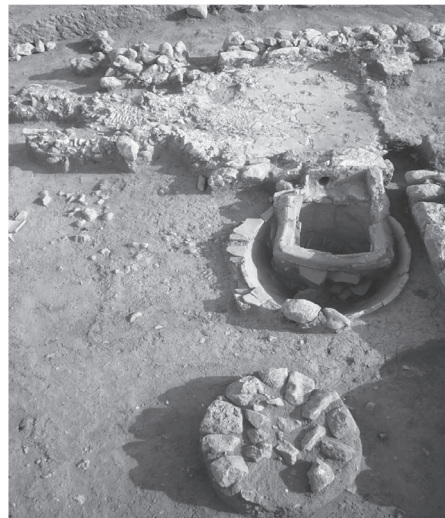
Εικόνα 3. Ο ληνός και το υπολήνιο.