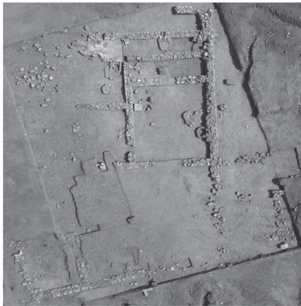
Εικόνα 2. Αεροφωτογραφία κτηριακού συγκροτήματος. Στη ΒΔ γωνία διακρίνεται ο ληνός.