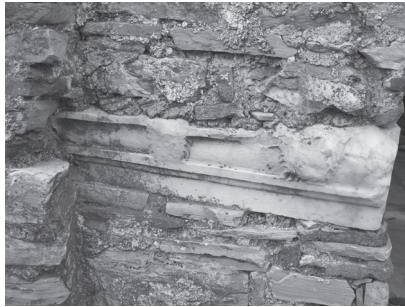
Εικ. 7. Τμήμα γείσου διακοσμημένου με λεοντοκεφαλές από το ρωμαϊκό κτήριο της Καισαριανής.