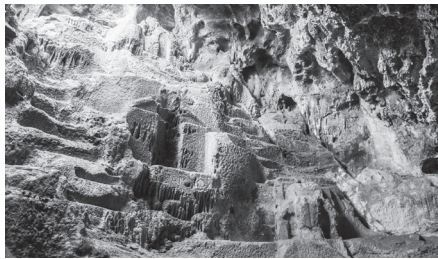
Εικ. 6. Βωμός και ανάγλυφο καθιστής θεότητας από το σπήλαιο του Πανός στη Βάρη.