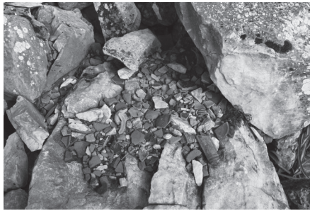
Εικ. 2. Όστρακα αγγείων στο εσωτερικό του κοιλώματος.