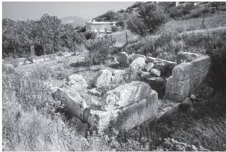
Εικ. 3. Άποψη του οπισθόδομου του αρχαϊκού ναού Β στο Κορωπί. Στο βάθος εξοχική κατοικία.