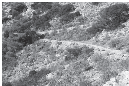
Εικ. 14. Άποψη της τοπικής οδού που οδηγούσε στους αρχαίους ναούς του οροπεδίου του Προφήτη Ηλία.