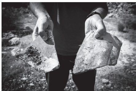
Εικ. 10. Κεραμίδια λακωνικού τύπου από το στρατόπεδο του κεντρικού Υμηπτού.