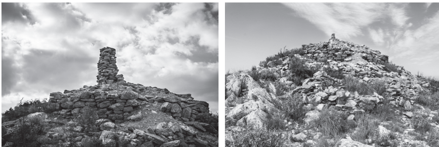
Εικ. 8. Ο πύργος του Κορακοβουνίου σε φωτογραφίες του 2012 και 2015. Στη δεξιά φωτογραφία ξεχωρίζει ο μεγάλου ύψους στύλος κατασκευασμένος πρόσφατα από αρχαίο δομικό υλικό.