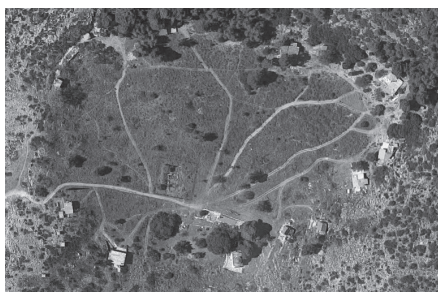
Εικ. 4. Αυθαίρετες κατοικίες περιμετρικά των αρχαϊκών ναών.