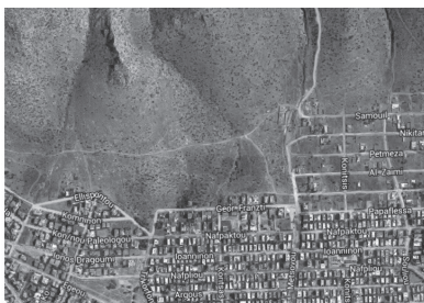
Εικ. 13. Οι αναβαθμίδες στην περιοχή της Γλυφάδας που σώζονταν σε καλή κατάσταση μέχρι τη δεκαετία του '50 έχουν σήμερα αντικατασταθεί από οικοδομικά τετράγωνα.