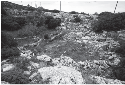
Εικ. 1. Άποψη του κοιλώματος των αρχαϊκών βωμών της κορυφής του Υμηττού. Το αυτοκίνητο βρίσκεται στη θέση του δρόμου που διέρχεται πάνω από τα αρχαία κατάλοιπα.