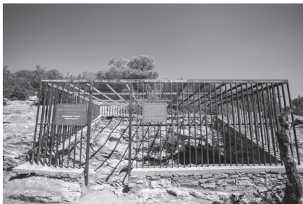
Εικ. 5. Άποψη της παραβιασμένης εισόδου του σπηλαίου του Πανός στη Βάρη.