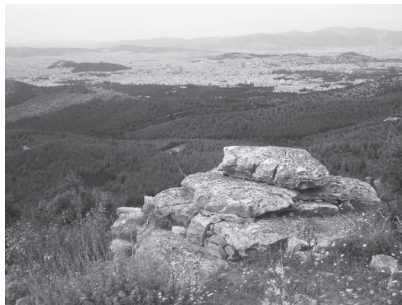
Εικ. 11. Μεγαλιθικό μνημείο Υμηπτού.