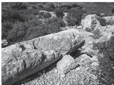
Εικ. 12. Ρωμαϊκό λατομείο στο Σέσι Κορωπίου. Στη δεξιά φωτογραφία (2015), τμήμα του κίονα έχει αποκολληθεί.