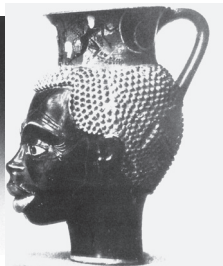
Εικ. 5. Απικό μονοπρόσωπο αγγείο. Γ' τετ. 6ου αι. π.Χ. (Boardman 1996, εικ. 193).