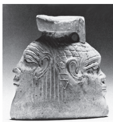
Εικ. 4. Αρυβαλλόσχημο αμφιπρόσωπο πλαστικό αγγείο από την Κύπρο. Τέλος 7ου – αρχές 6ου αι. π.Χ. (Snowden 1997, εικ. 15).