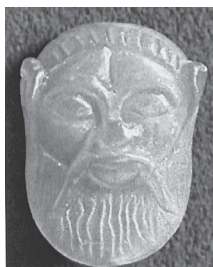
Εικ. 11. Ψευδοσκαρα- βαίος από στεατίτη του Συρίν. Β΄ μισό 6ου αι. π.Χ. {Boardman 1968, 2, πίν. I (iv)}.