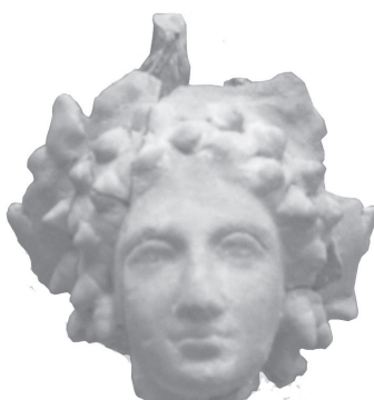
Εικ. 13. Πλαστικό αγγείο με κεφαλή Διονύσου. Ύστερος 4ος αι. π.Χ. (Κ3052).