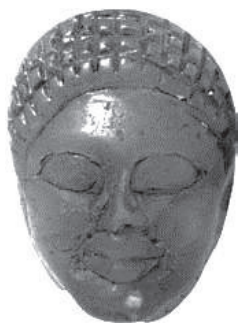
Εικ. 7. Νησιώτικος ψευδοσκα- ραβαίος ΕΑΜ. Β΄ μισό 6ου αι. π.Χ. (Στασινοπούλου-Κακα- ρούγκα 2014, Χρ618).