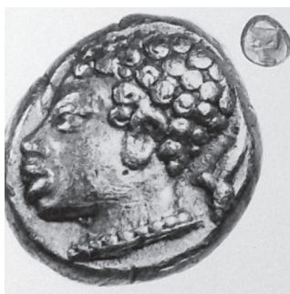
Εικ. 8. Νομισματοκοπείο Φώκαιας. 530 π.Χ. (Bodenstedt 1981, πίν. 63 (5.1).