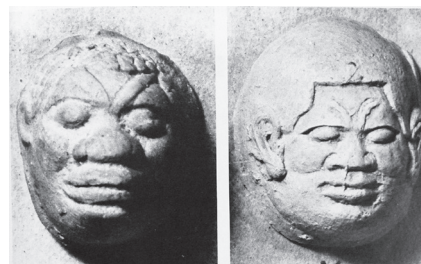
Εικ. 6. Πήλινες μίτρες σκαρβαίων από τη Ναύκρατη. Τέλος 7ου – αρχές 6ου αι. π.Χ. (Snowden 1997, εικ. 18).