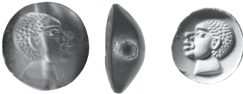
Εικ. 1. Ο σφραγιδόλιθος M1060.

presence in Vravra having in mind that Negroes were often related with the god's worship as well the tradition that Peisistratos took care of Rural Dionysia in the wine-growing region of Attica.