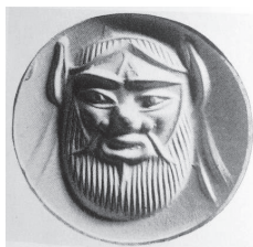
Εικ. 10. Σφραγιδόλι- θος από χαλκηδόνιο με μορφή Σατύρου. Β΄ μισό 6ου αι. π.Χ. (Boardman 2001, πίν. 274).