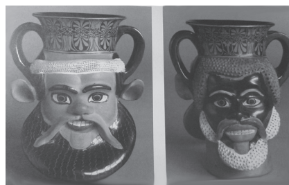
Εικ. 12. Αττικό αμφιπρόσωπο αγγείο. Α΄ μισό 5ου αι. π.Χ. (CVA Cleveland, Museum of Art 2, πίν. 78.1-4).