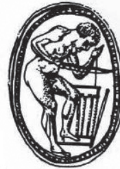
Εικ. 3. Σκαρβαίος με παράσταση σφραγιδοντύφου. Βρετανικό Μουσείο, 5ος αι. π.Χ. (Μπουλώτης 1983, εικ. 8).