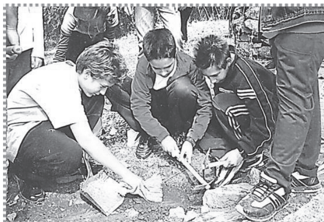
Στιγμιότυπο από το εκπαιδευτικό πρόγραμμα «Πώς γίνεται μια ανασκαφή».