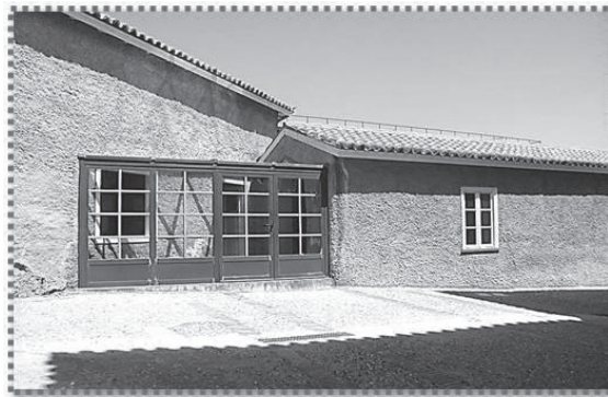
Εξωτερική Άποψη του χώρου όπου στεγάζεται το ΒΒΕΜ.

the area. The objective of the Handicraft-Industrial Educational Museum is to collect, preserve, research and exhibit materials, for educational purposes, which relate to the handicraft and industrial past of the region and also by extension to the technological, economic, social and cultural history of Greece. The Museum utilizes contemporary, recognized educational theories and develops and offers multifaceted educational experiences and recreation for children, adolescents, young people, teachers and families. The Handicraft-Industrial Educational Museum is, in effect, a “living workshop” linking the many dispersed historical landmarks found in the Lavrion region. This networking, in itself, constitutes a landmark in the Museum’s educational journey.