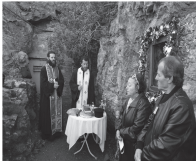
Στιγμιότυπο από την δέηση της Αγ. Βαρβάρας.