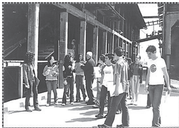
Στιγμιότυπο από το εκπαιδευτικό πρόγραμμα «Η Μεταλλουργία στην παλιά Γαλλική Εταιρεία Μεταλλείων Λαυρίου».