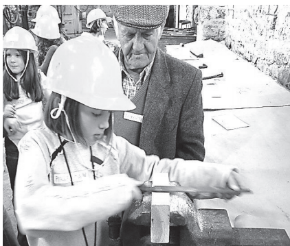
Στιγμιότυπο από το εκπαιδευτικό πρόγραμμα «Εργαλεία και μηχανές».