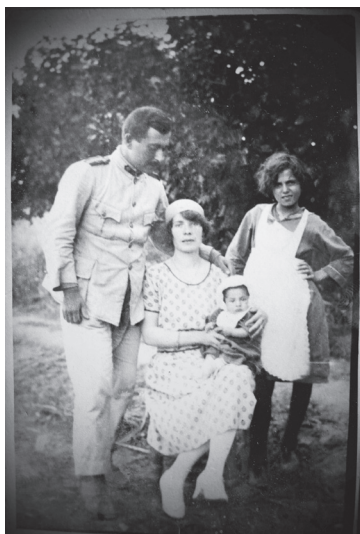
Οικογενειακή φωτογραφία, Σμύρνη 1921