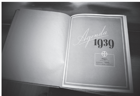
Το ημερολόγιο του Α. Αλεξάνδρου