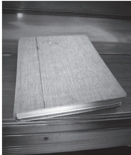
Το ημερολόγιο του Α. Αλεξάνδρου