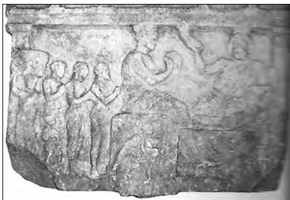
Εικ. 9. Στήλη με ανάγλυφη παράσταση νεκρόδειπνου από το Νιράφι (οικία Τζάννου).