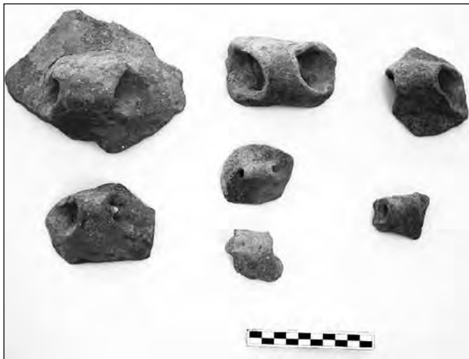
Εικ. 7. Χαρακτηριστικές λαβές από την ΠΕ εγκατάσταση στο οικόπεδο ΟΣΚ Πικερμίου.