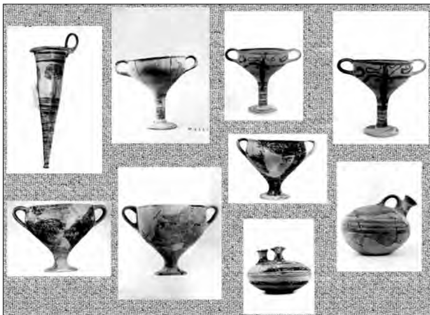
Εικ. 4. ΥΕ IIIA-IIIΒ αγγεία από τους λαξευτούς μυκηναϊκούς τάφους του Πικερμίου.