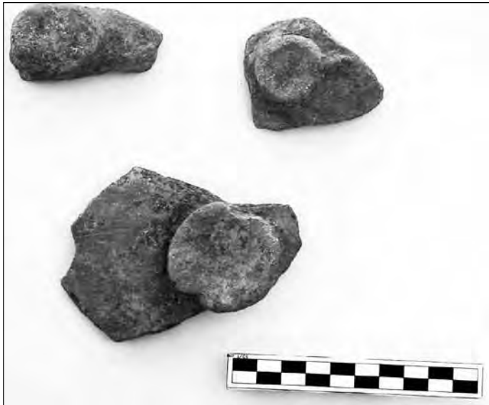
Εικ. 6. Όστρακα με κομβιόσχημες αποφύσεις από την ΠΕ εγκατάσταση στο οικόπεδο ΟΣΚ Πικερμίου.