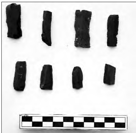
Εικ. 8. Λεπίδες οφριανού από την ΠΕ εγκατάσταση στο οικόπεδο ΟΣΚ Πικερμίου.