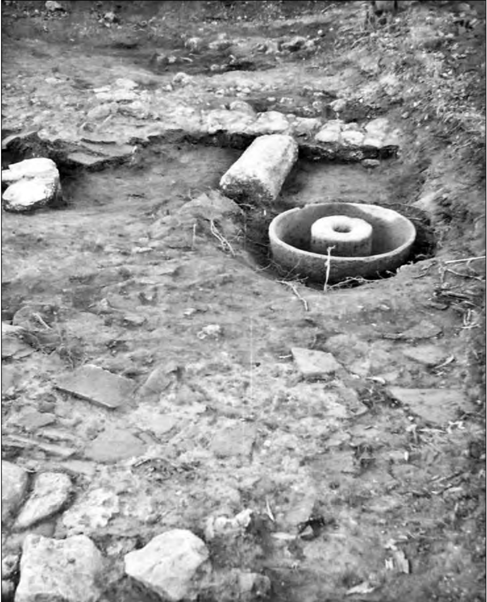
Εικ. 3. Εργαστηριακός χώρος, Λεωφ. Μαραθώνος, Νέος Βουτζάς.