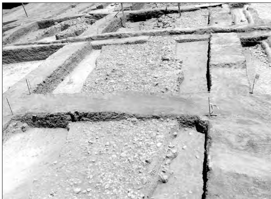
Εικ. 5. Λιθόστρωτες επιφάνειες ΠΕ εγκατάστασης στο οικόπεδο ΟΣΚ Πικερμίου.