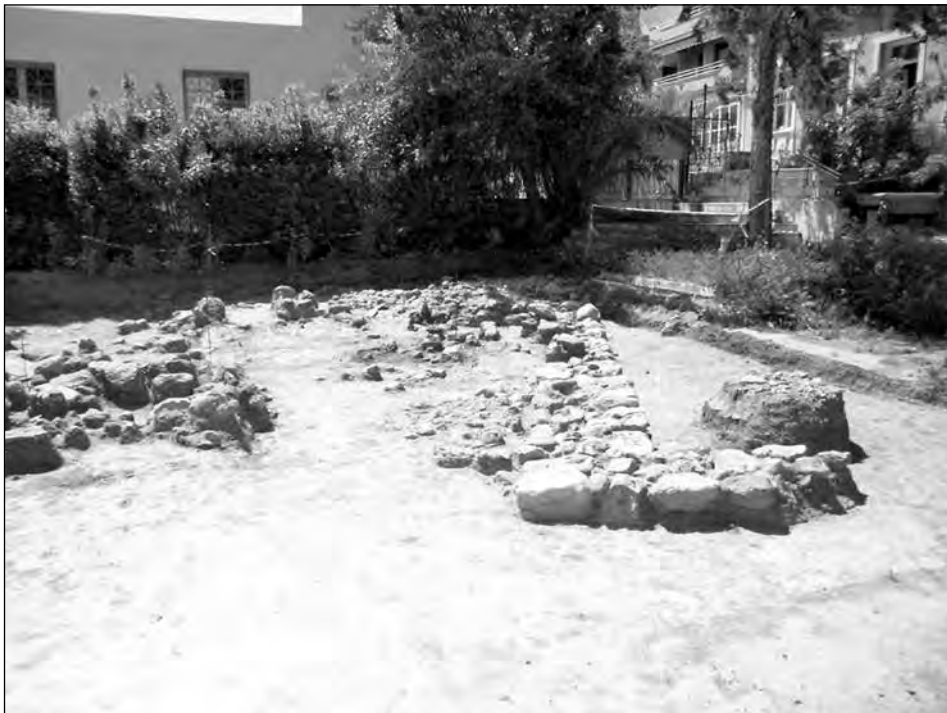
Εικ. 2. Η ανασκαφή στην Πλατεία Ταχυδρομείου της Ραφήνας σε αρχικό στάδιο.