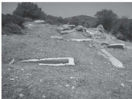
Εικ. 1. Ο ταφικός περίβολος «της Βασιλοπού- λας», μετά τον καθαρισμό.