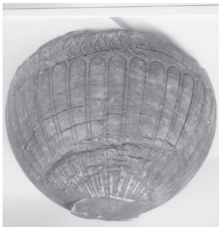
Εικ. 3. Ο μαρμάρινος λέβης.