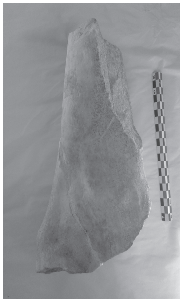
Εικ. 7. Πόδια ίππου.