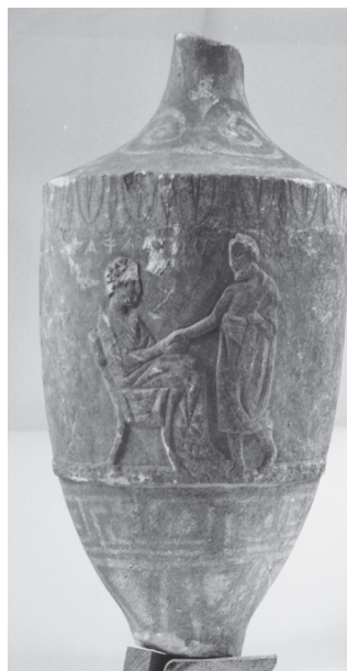
Εικ. 8. Η μαρμάρινη επιτύμβια λήκυθος της Παφλαγονίδος.