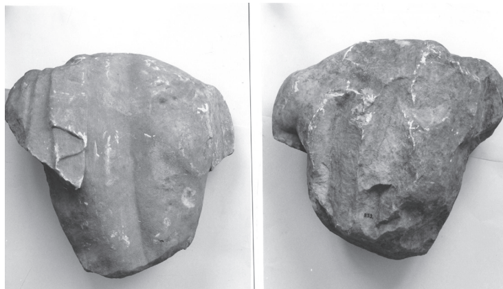
Εικ. 5-6. Ο κορμός του ιππέα.